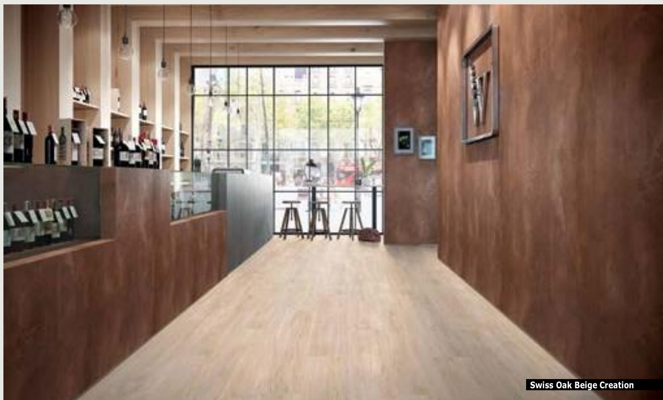
Swiss Oak Beige Creation

Nová kolekce podlah je založena na třech výrazných designových trendech