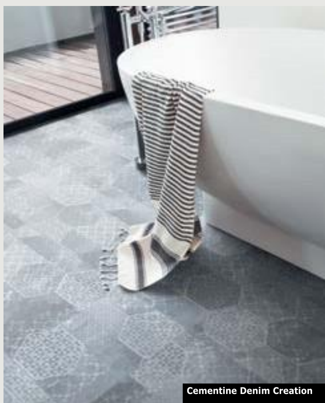
Cementine Denim Creation

je interpretací městského života a geometrických přímek mrakodrapů. Z těchto trendů čerpá design Cementine (CREATION 30) , který kombinuje betonový efekt s hexagonálními motivy.